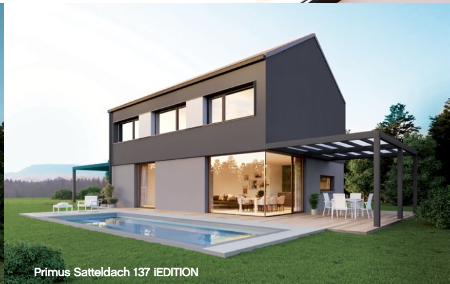
Primus Satteldach 137 iEDITION