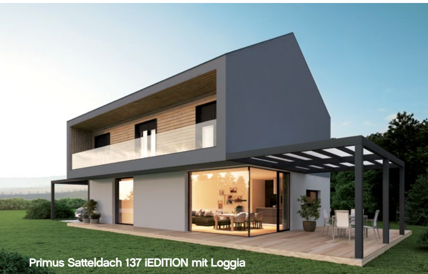
Primus Satteldach 137 iEDITION mit Loggia