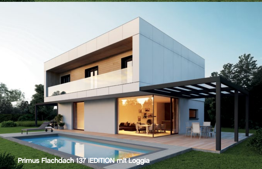
Primus Flachdach 137 iEDITION mit Loggia